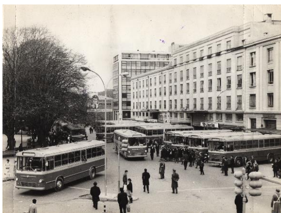
Imagen 5. Inauguración de servicio de buses Pegaso en la Plaza Independencia de Concepción, 1967.

Por otra parte, René Pérez “hizo una recomendación a los choferes de la Empresa, para que atendieran amablemente a los pasajeros y pidió a los niños que cuidaran las máquinas, porque era un patrimonio de todos” 111 .