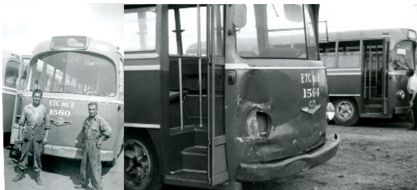
Imágenes 3 y 4. Dos fotografías del Depósito de la Zonal Antofagasta hacia inicios de los años sesenta. A la izquierda, dos mecánicos, que debían lidiar con la crónica falta de repuestos. A la derecha, uno de los autobuses OM chocados, mientras un chofer limpia una de las máquinas.